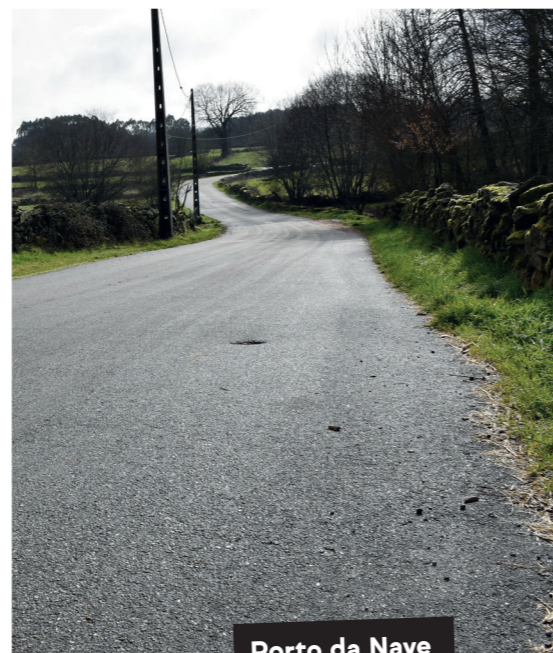
Porto da Nave