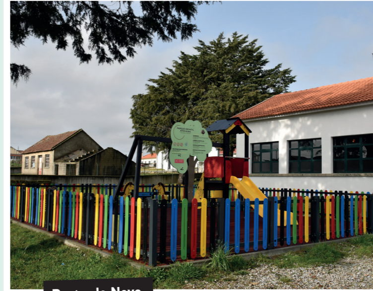
Porto da Nave